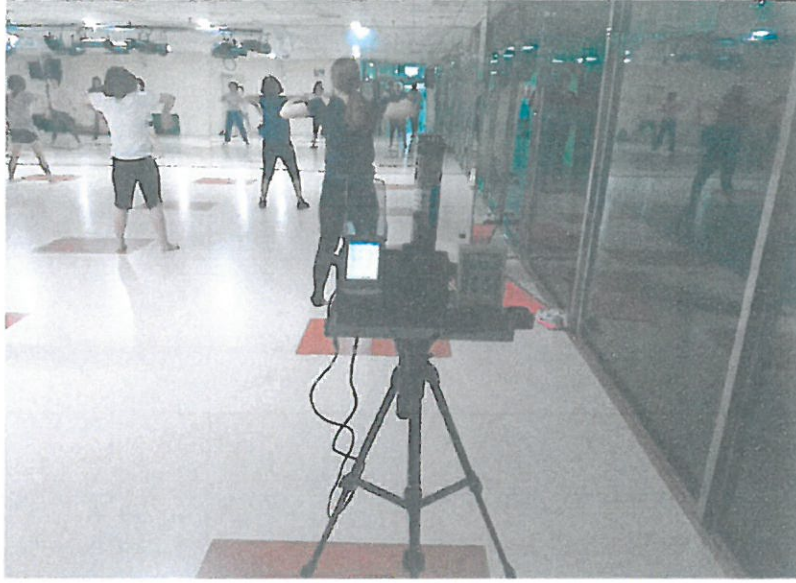
B1F - 에어로빅실