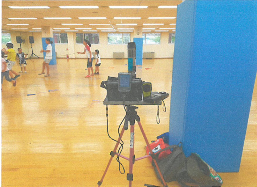
1F - 소체육관