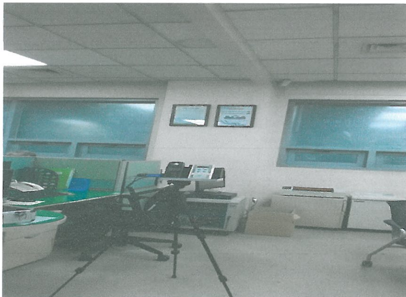
1F - 사무실