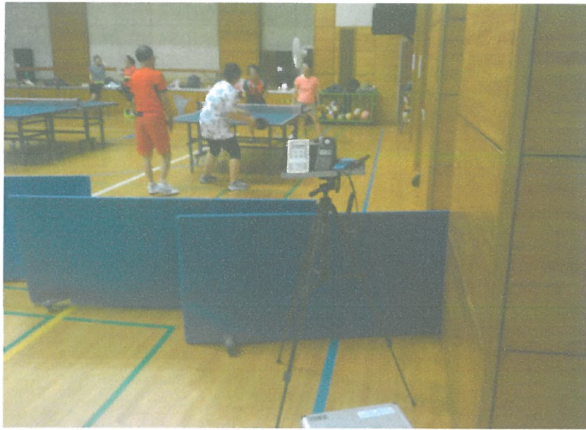
2F - 대강당