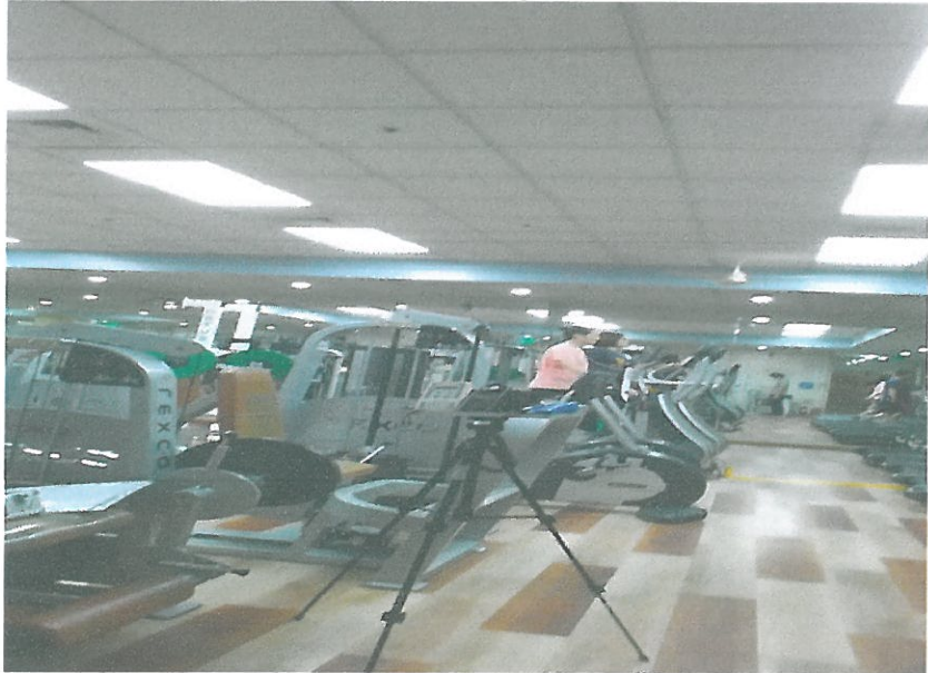
B1F - 헬스장