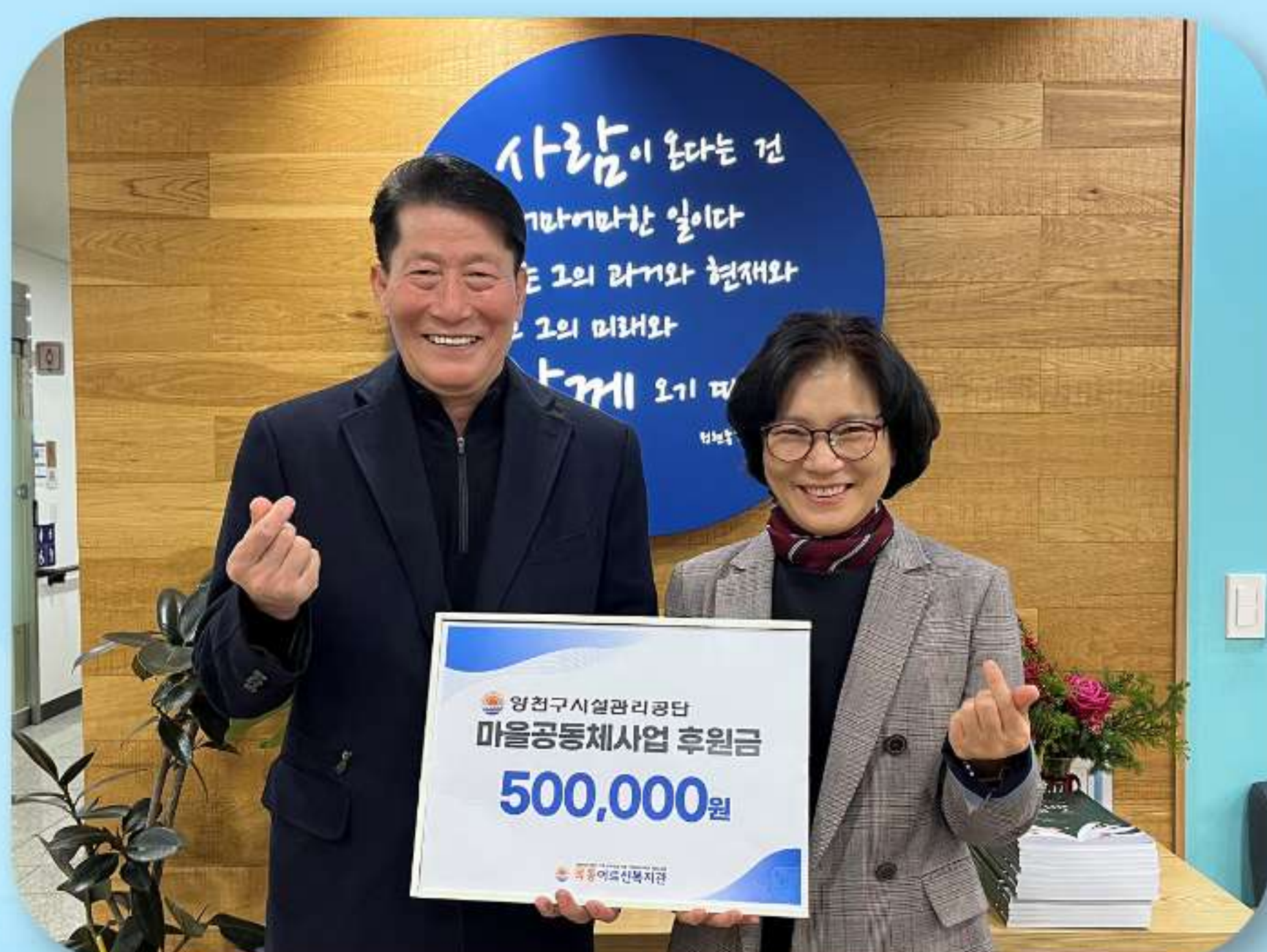
목동어르신복지관 50만원 기부