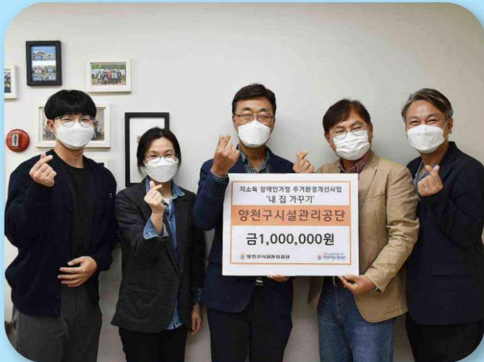
양천해누리복지관 100만원 기부