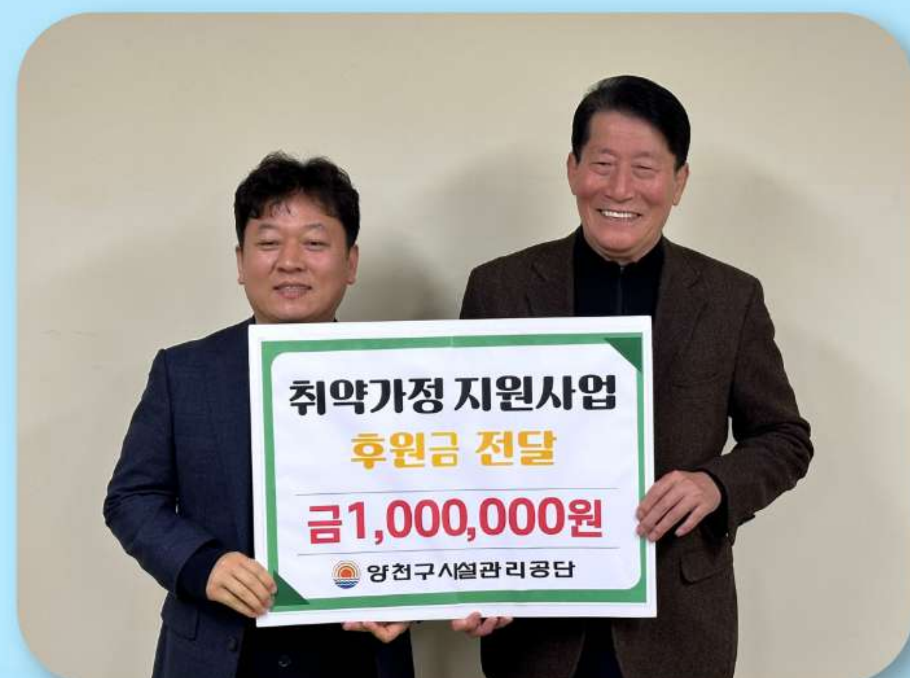
신월종합사회복지관 100만원 기부