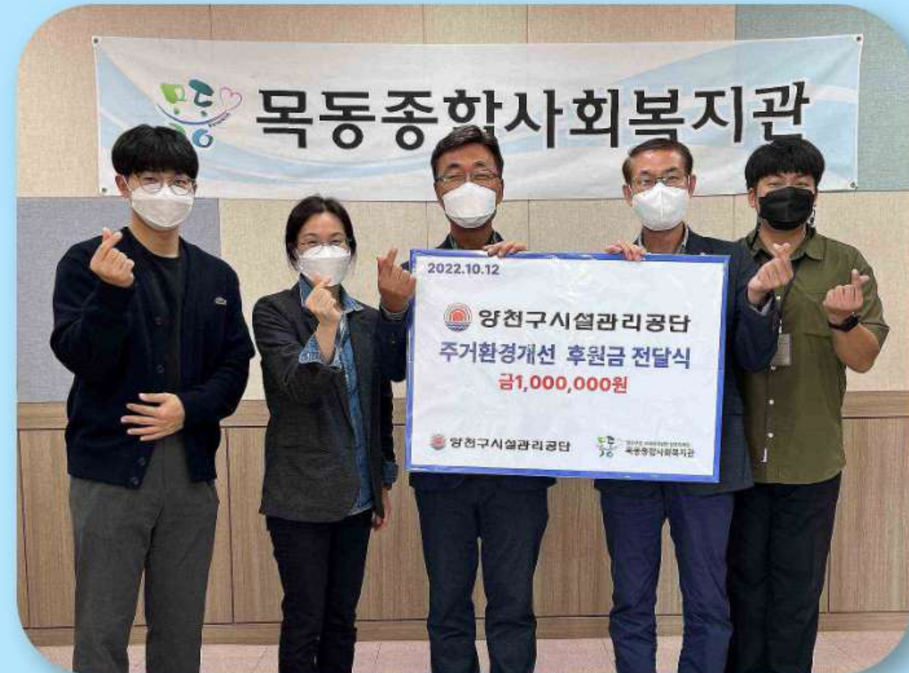
목동종합사회복지관 100만원 기부