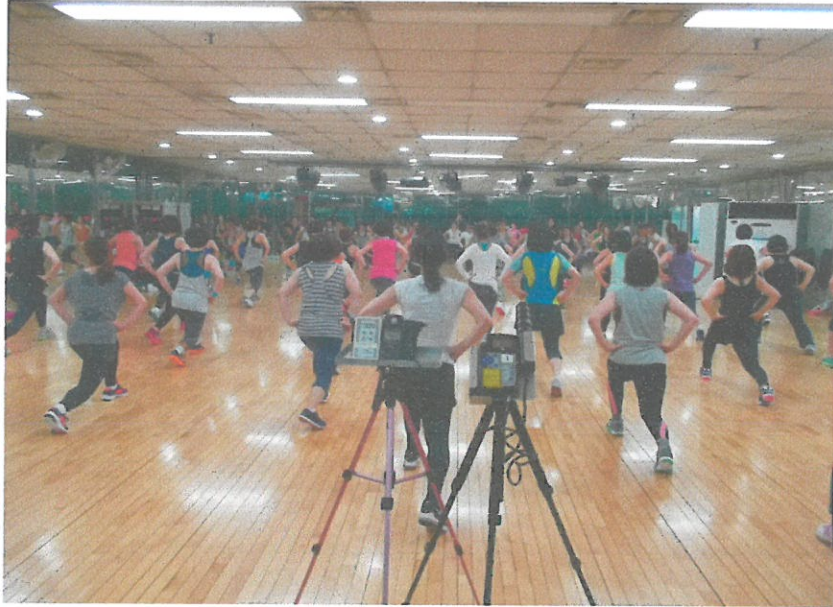
1F - 다목적실