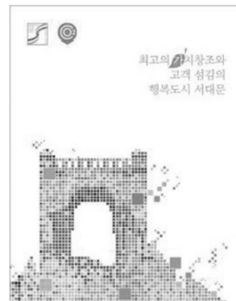
서대문구도시관리공단에서 제작 배포한 브로슈어 표지.

헌 활동, 녹색경영 사례 등을 한눈에 보고 이해할 수 있도록 사진과 컬러를 이용해 알기 쉽게 구성했다. 특히 사업장을 크게 △문화·교육 △주차관리 △생활체육 △창업보육 등으로 구분해 고객들이 원하는 정보를 빠르게 확인할 수 있도록 했다. 문화·교육 시설에는 서대문형 무소역사관, 서대문문화회관, 구립이진아기병도서관, 남가좌새롭