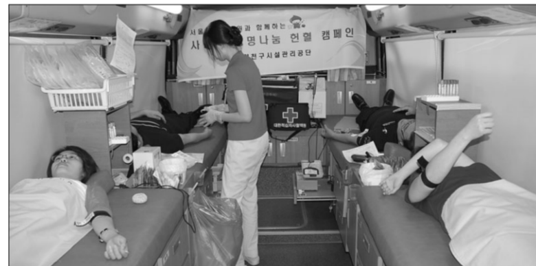
양천구공단 직원들이 '생명나눔 헌혈 캠페인'에 참여해 단체헌혈을 하고 있다.