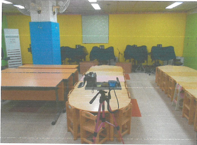
1F - 창작실