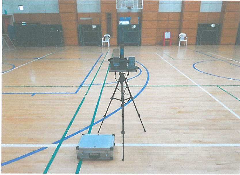
2F - 대강당