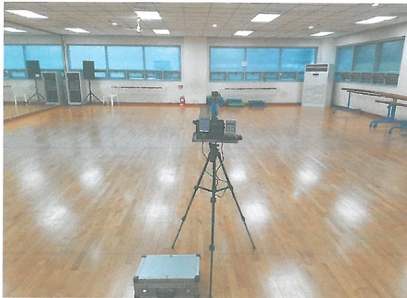
1F - 소강당