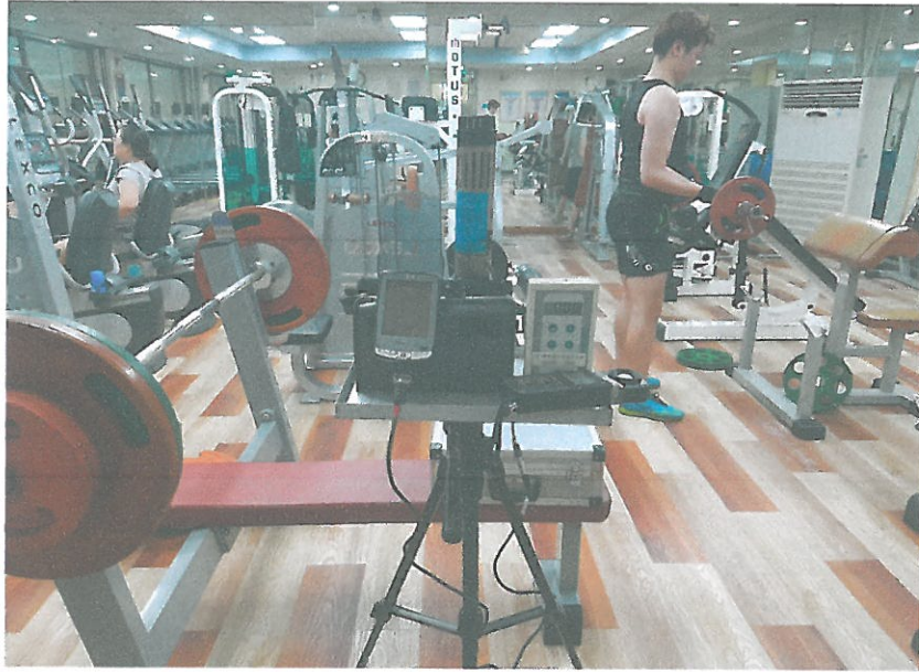
B1F - 헬스장